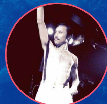
スベリーマーキュリー