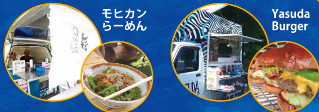
モヒカン らーめん