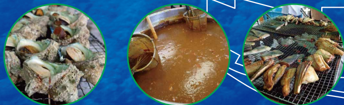
江之浦サザエつぼ焼き 江之浦サザエご飯